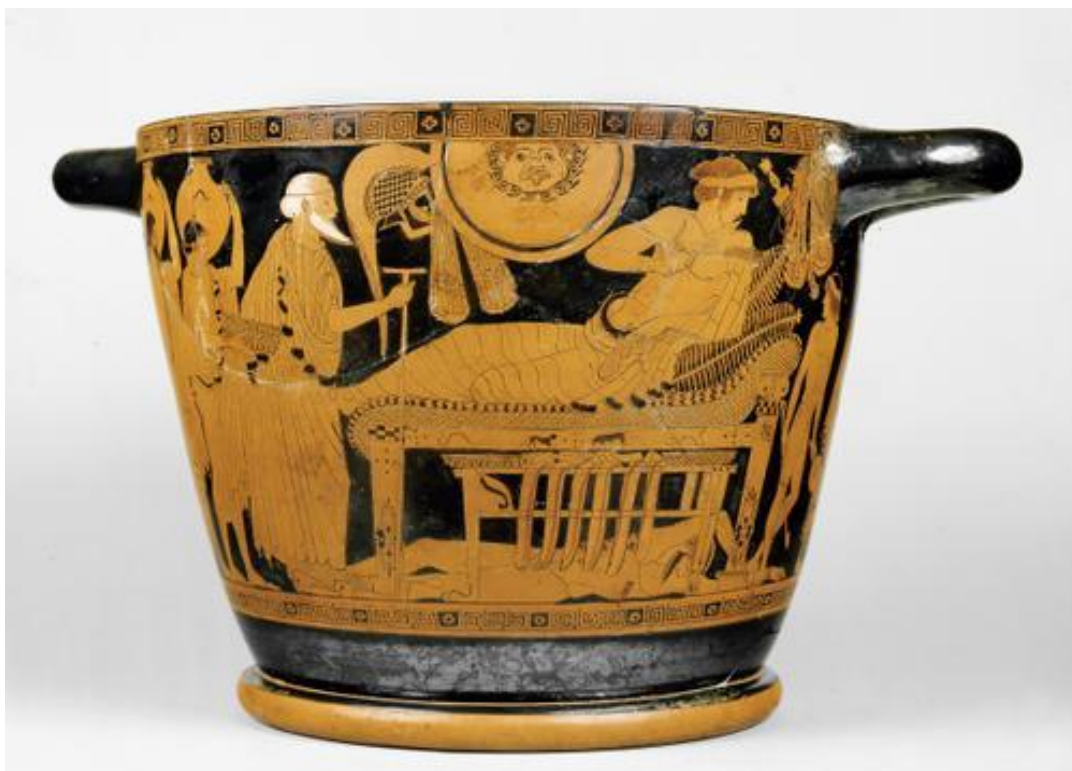
Rödfigurigt dryckeskärl, ca 480 f.Kr. Bilden visar den gamle kung Priamos (till vänster) hos Achilles för att lösa ut sonen Hektors döda kropp (under soffan).